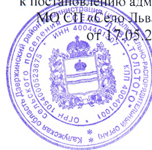
СХЕМА ТЕПЛОСНАБЖЕНИЯ Сельского поселения «Село Льва Толстого» Дзержинского района Калужской области на период с 2018 по 2028 год

Приложение к постановлению администрации МО СП «Село Льва Толстого» от 17.05.2018г. № 43